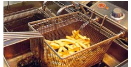
Aceite de colza, de girasol y aceite usado en fritura son ejemplos de materia prima utilizable.